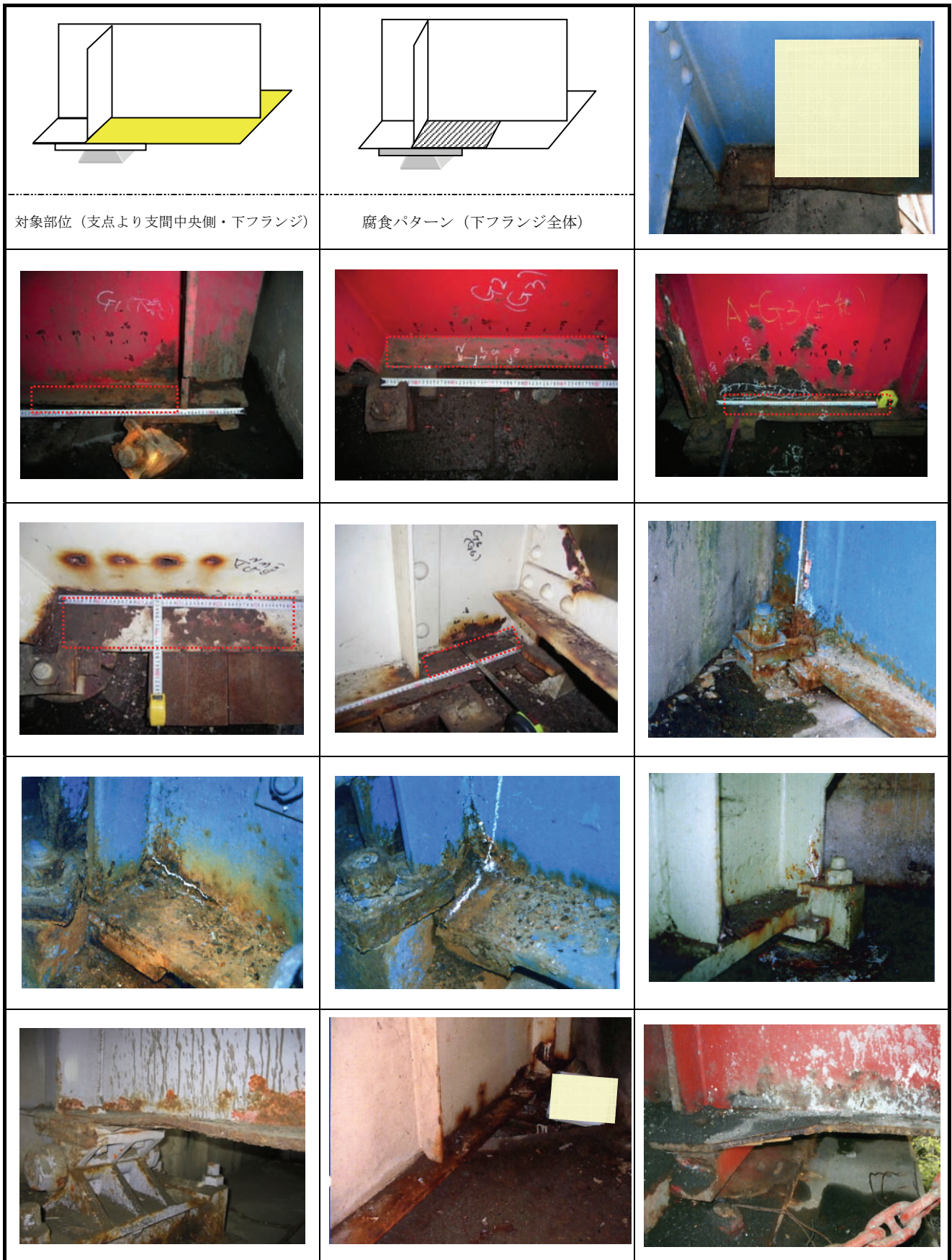
図-3.9(1) 腐食事例（支点より支間中央側・下フランジ）