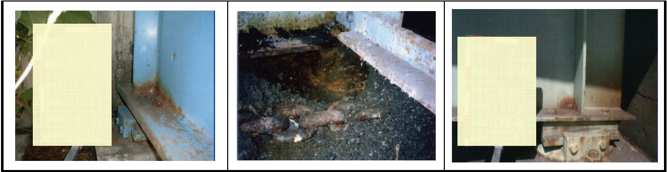
図-3.9(3) 腐食事例（支点より支間中央側・下フランジ）