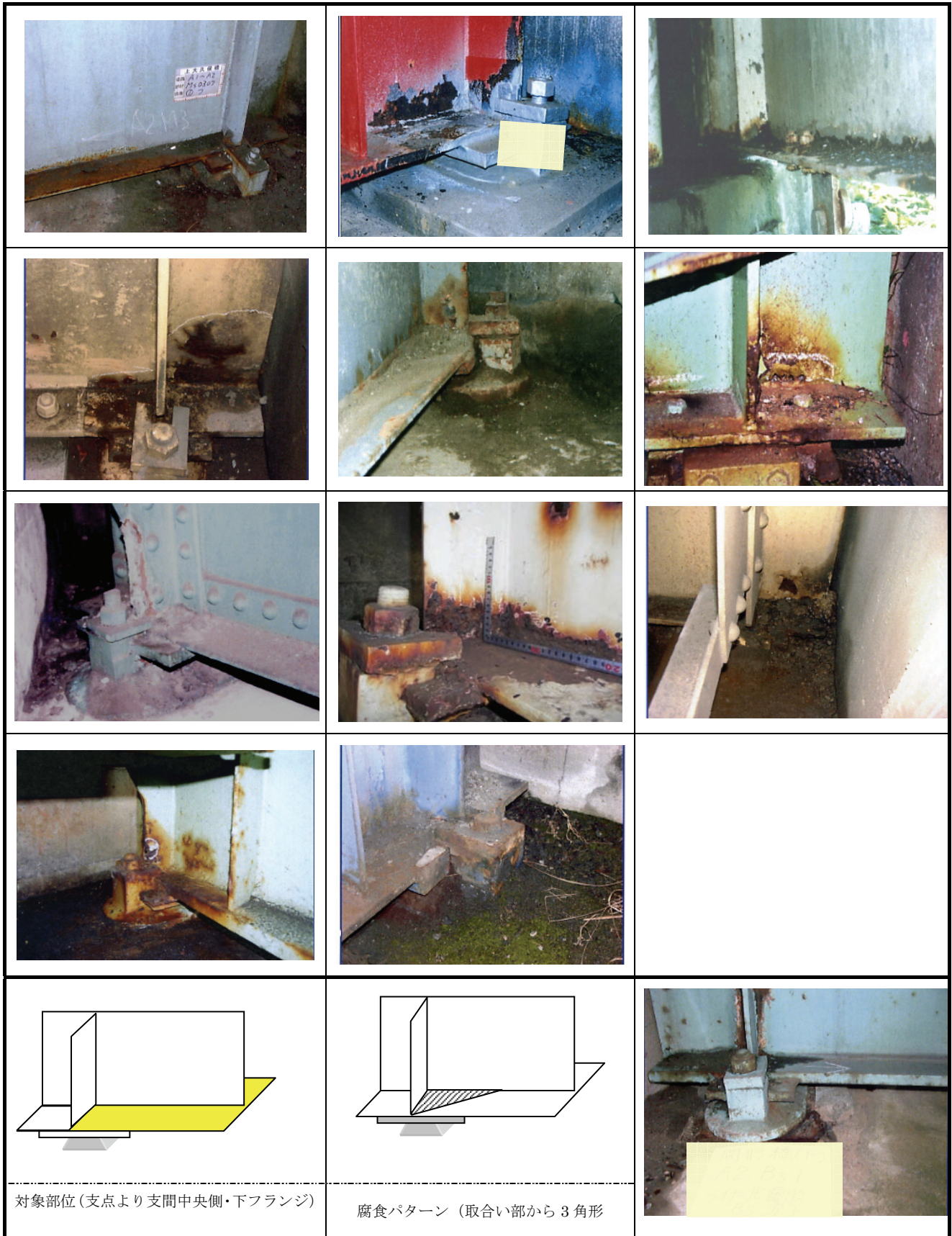
図-3.9(2) 腐食事例 (支点より支間中央側・下フランジ)