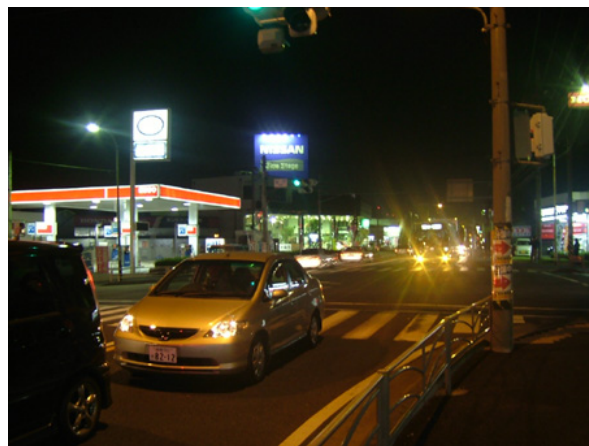
図-2・4(9) 事故発生要因事例 (A6)