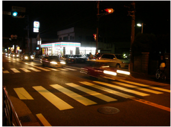
図-2・4(7) 事故発生要因事例 (A1)

[道路の周囲のコンビニや飲食店への駐車場への車両の流入出のため、交通流が乱れている]