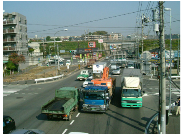
図-2・4(10) 事故発生要因事例 (左 : B3、右 : A4) [交通量が多く、無理な運転行動をしがち]