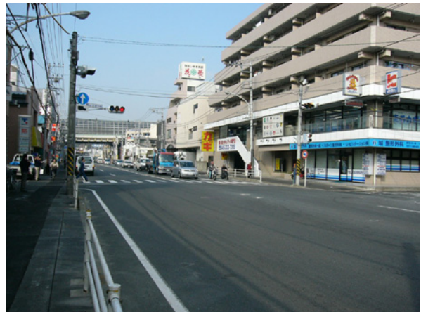
図-2・4(8) 事故発生要因事例 (B1)