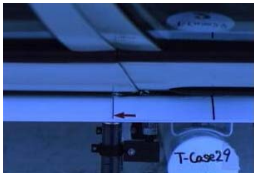
9) 金属片と車両が接触