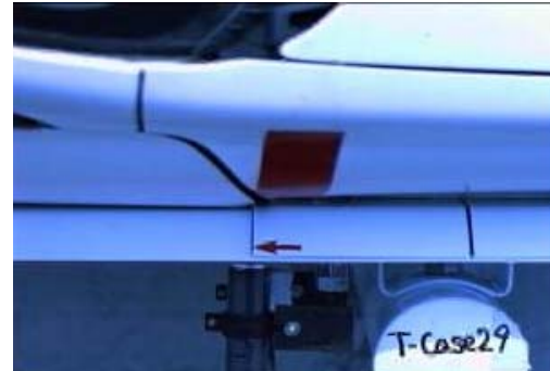
3) 運転席ドア部分が継ぎ目に接触