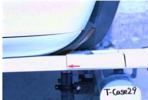
2) バンパーが継ぎ目に接触