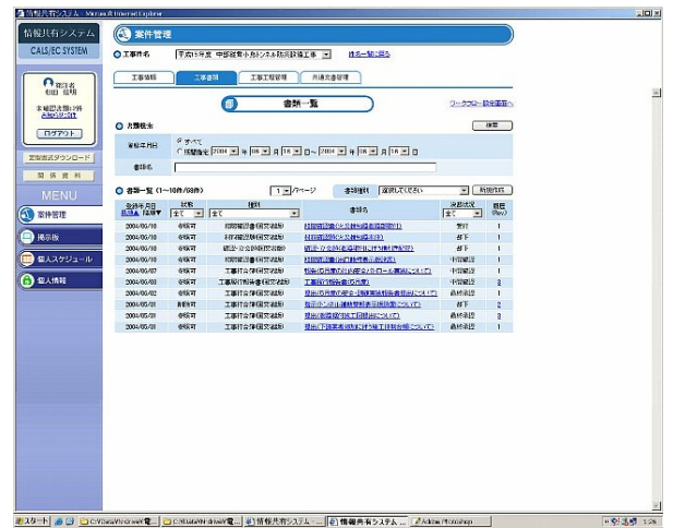
図 5-25 登録書類一覧表示