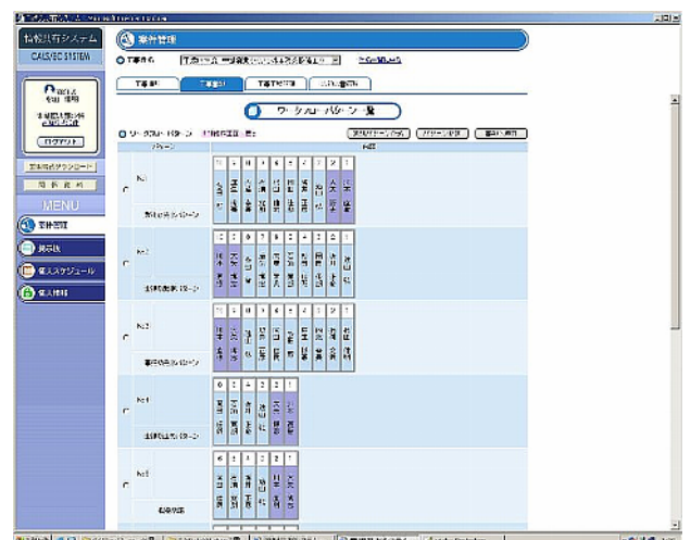
図 5-27 ワークフロー選択