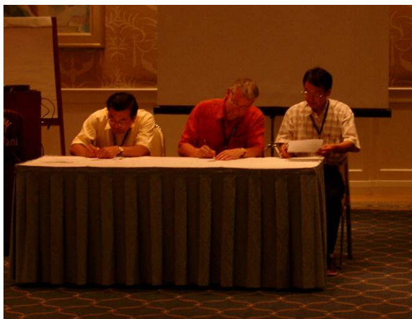
写真 3 会議概要への署名