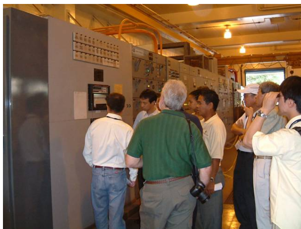
写真 5 ホノウリウリ下水再生施設