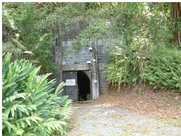
写真 4 ワイフェ取水トンネル孔口