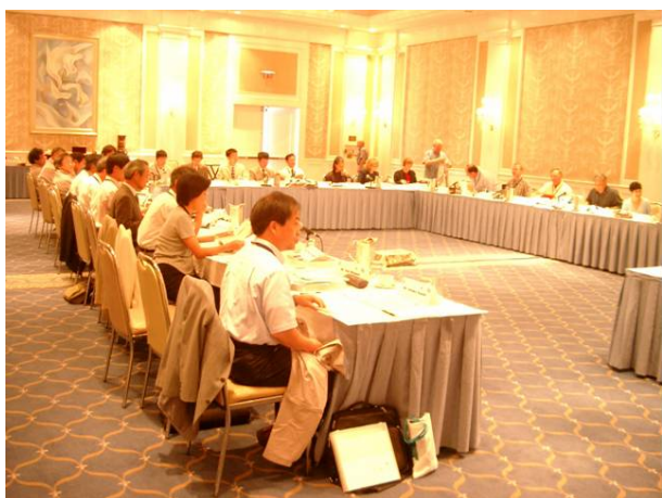
写真 1 会議の様子