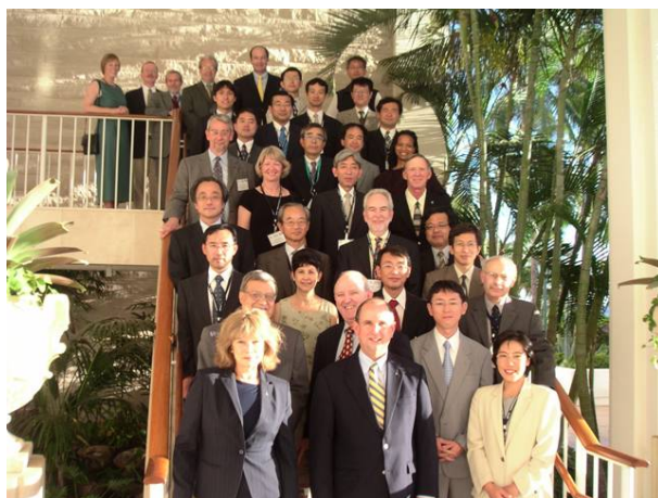
写真 2 参加者の集合写真