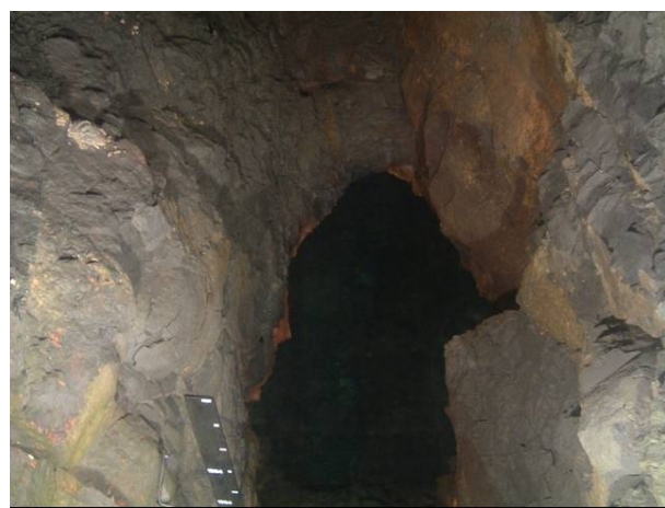
写真 6 ハラワ水源