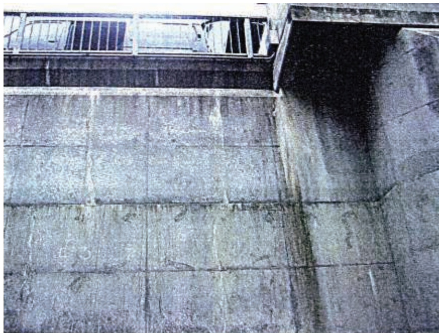
写真 2.14 上流面：BL6