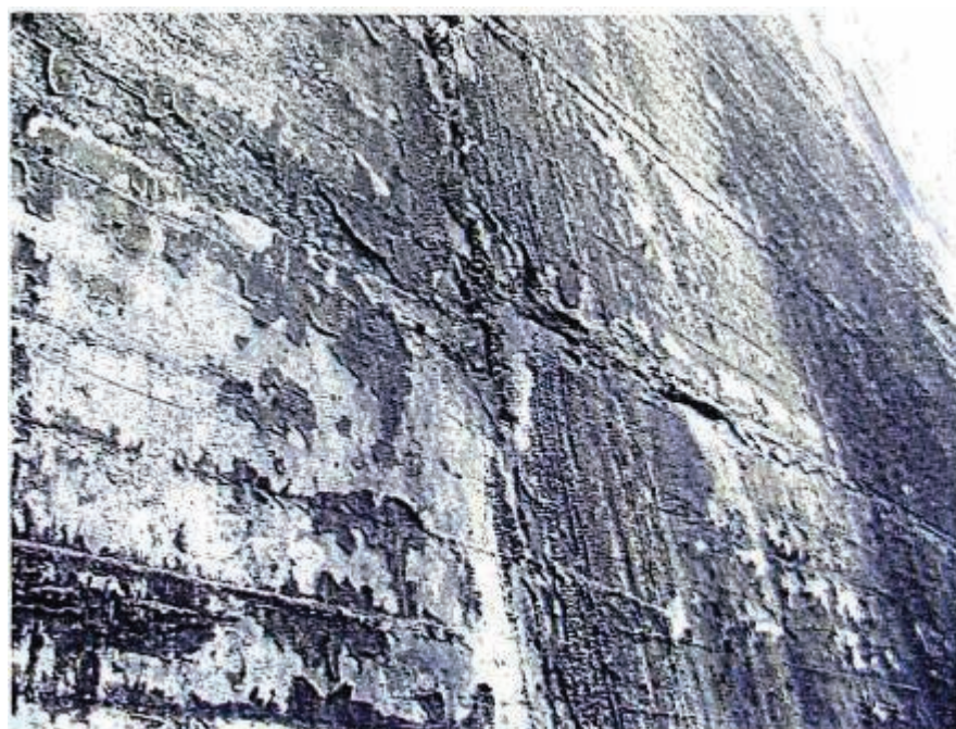
写真 2.12 上流面：J7 付近