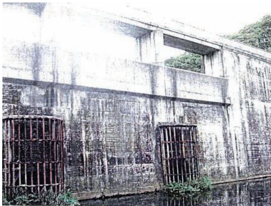
写真 2.11 上流面：洪水吐周辺