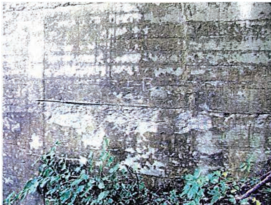
写真 2.13 上流面：BL12 付近