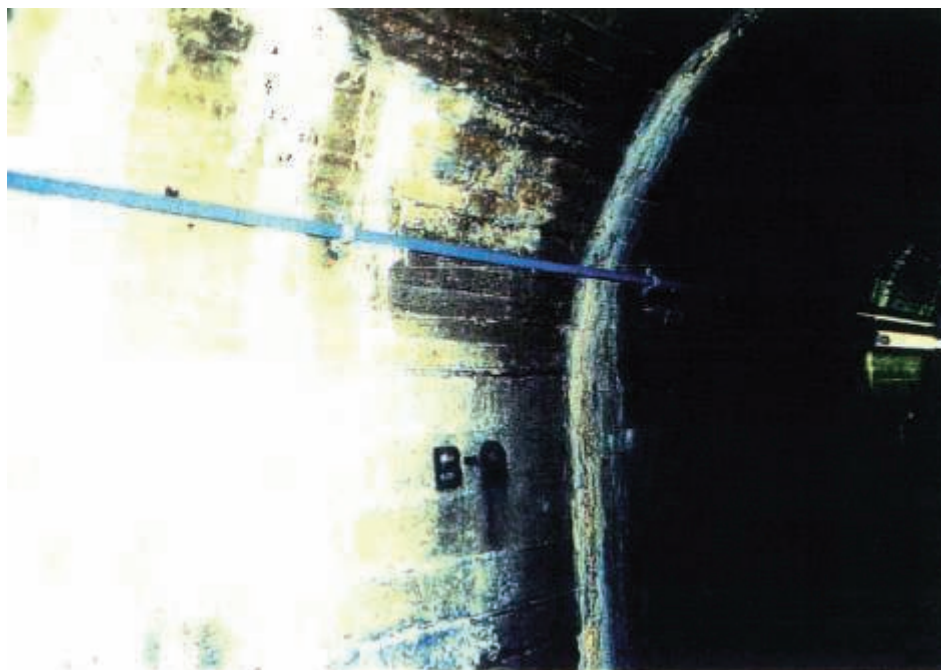
写真 2.16 監査廊内 J8 付近