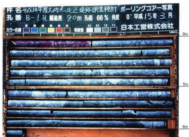
写真 2.13 B-1 中性化試験