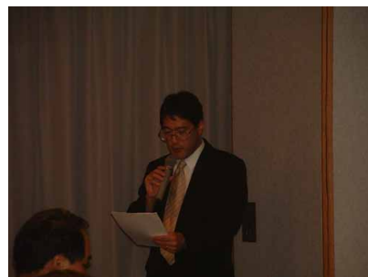
笹原上席研究員（土木研究所）