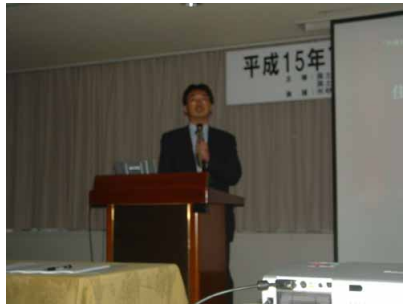
中森助教授（日本大学）