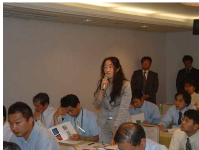
巖倉氏（北海道開発局）