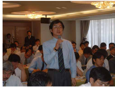
安養寺氏（砂防・地すべり技術センター）