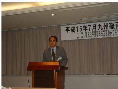
杉浦センター長（国土技術政策総合研究所）