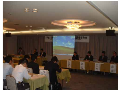
小山内室長（国土技術政策総合研究所）