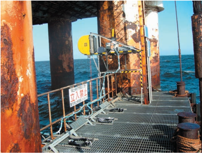
図-A.3 システム全体写真