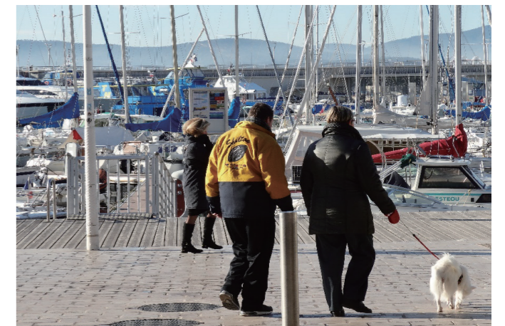
マリナーと接するプロムナードで憩う人々(サン・ラファエル@フランス)

なお、平成31年度以降は実際のみなとまちづくりの現場への支援を進めつつ、調査・計画・空間形成手法等に係るガイドラインについて検討することとしております。