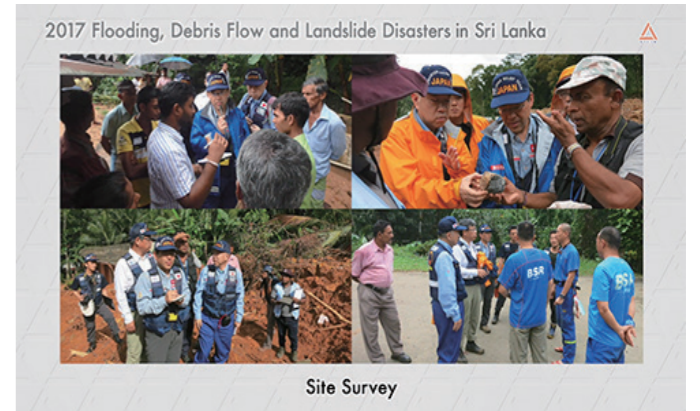
PR映像の一場面(スリランカ土砂災害支援)

完成したプロモーション映像は、アジア土木技術国際会議(CECAR8)の展示ブースにて公開しました。