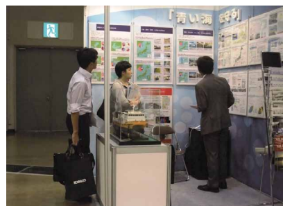
写真 ブース出展の様子

今後も、積極的に多くのイベント参加を行い、研究成果の発表や紹介を行う等、積極的な広報広聴活動に努めていきます。