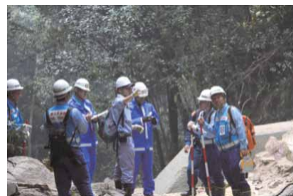
写真 現場での災害状況把握

溪流及びその周辺の溪流を対象とし、TEC-FORCE(各地方整備局や国総研の職員で構成)によって計324溪流で行われました。主な調査内容は、溪流内における土砂、流木の堆積状況、人家付近の斜面変状(崩壊の発生等)です。点検結果を踏まえ、各溪流の危険度評価を行い、公表いたしました。公表結果は、その後の警戒避難体制の検討に活用されました。