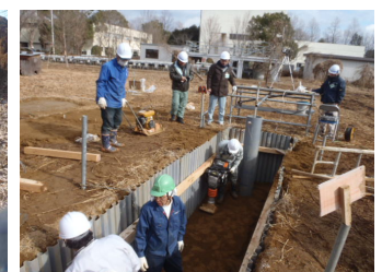
塩ビ管の施工状況