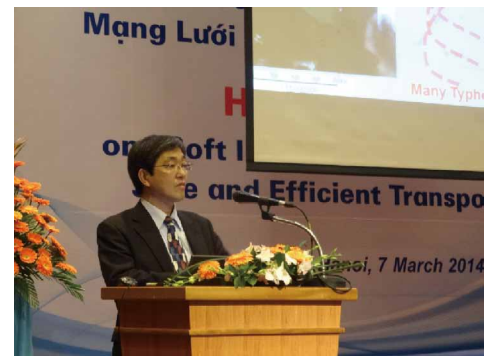
写真 ハイレベルセミナーでの講演

国土交通省とベトナム交通運輸省との間で「港湾施設の国家技術基準の策定に関する協力に係る覚書」が署名されました。また、同日同地にて開