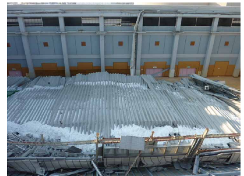
写真 体育館の屋根崩落

3月10日に開催された社整審建築分科会建築物等事故・災害対策部会(第19回)に、これら被害調査が報告されると