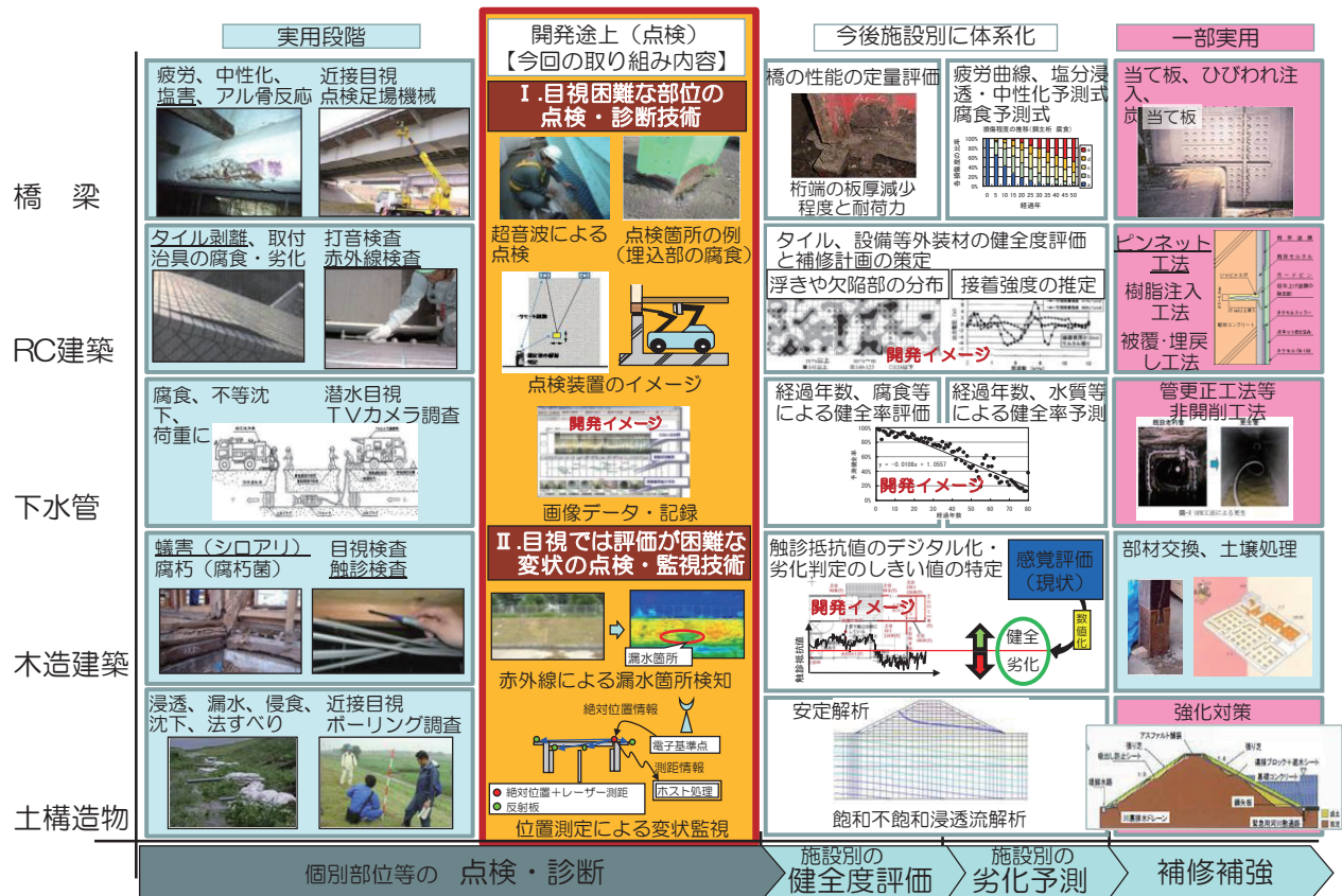
図-1.1.2 研究開発技術全体像のイメージ (研究着手時点)

赤外線サーモセンサーを活用し、現状では検知が不確実であった河川堤防のり面の湿潤部を迅速・簡便に把握する点検・監視技術、および位置の特定技術を活用し、橋梁等構造物の突発的、致命的変状を迅速・簡便に把握する監視・変状探知手法の開発することを目的とした。