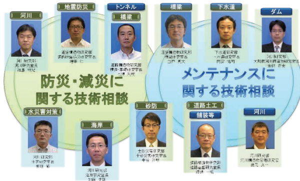
図-1 国総研技術相談窓口

住宅・社会資本整備に関わる技術者が日頃から感じている疑問や悩みなどについても、問い合わせることができるように、「国総研技術相談窓口」(図-1)を平成26年12月から設置しており、国総研が担当するあらゆる分野・施設に関する相談事項をワンストップで受け付けている。