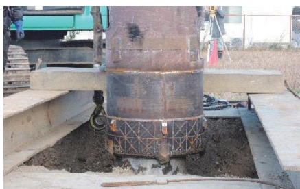
写真-1 実験での既存杭撤去工事の様子

本課題では、写真-1のように一度杭が撤去された地盤に再構築された杭の実大水平載荷試験や、実擁壁の水平載荷試験等の大型実験を、産学官の協力の基に実施するなど、当該分野のオールジャパン体制を構築し、都市再生に資する技術的的確な社会実装に向けて検討を進めているところである。