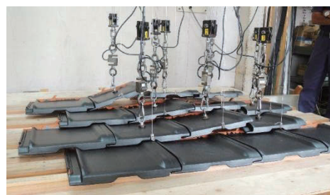
写真-2 瓦屋根の上方への引張載荷試験

国総研では、屋根ふき材、木造小屋組、および店舗の屋外に面する建具（フロントサッシ）の被害に着目し、これらの工事に関わる専門業者の方々と一緒に被害調査を行う等により、課題の抽出を行った。さらに、産学官一体となった被害軽減のための対策検討WGを主導し、写真-2に示すような試験を実施し、その成果を既往の設計・施工ガイドラインに反映することで、新築建築物に関するきめ細やかな対策技術を提案してきた。また、令和3年度からは、既存の屋根ふき材に対する耐風診断と改修の方法や、屋根ふき材の耐風性能ランクに関する検討を開始し、より強靱な屋根への誘導策につなげる予定である。