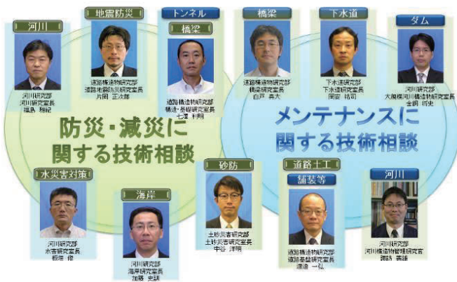
図-1 「国総研技術相談窓口」