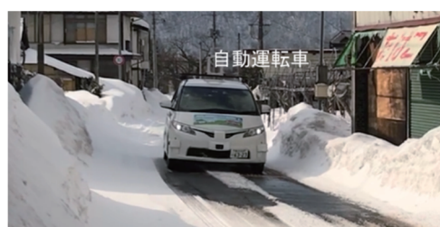
図3 積雪による狭小幅員(本来は2車線)

また、積雪に関しては、多少の圧雪が残る除雪された状態では、円滑に走行することができた。一方で、道路脇への除雪により幅員が狭くなり、対向車とのすれ違いが困難となる場合があった。このような箇所では自動運転車の走行を前提とした除雪や積雪時を考慮した走行位置の設定が必要と考えられる。