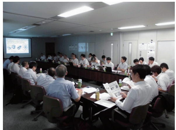
写真-1 コミュニティ活動の様子

実際の現場で活用できるロボット技術が開発されるようにするため、技術開発から社会実装に至るまでの各プロセスにおいて、具体的なテーマを設定して活動（写真-1 参照）を行っている。本年度は、昨年度から引き続き「インフラ点検情報3次元モデリング技術」に関して、ニーズ側からの情報提供やシーズ側からの技術提案に対する意見交換を行った。また、新たに「ロボット点検による成果品の納品要領」、「インフラ点検へのAIの活用」をテーマに議論を開始した。今後、これらの活動を検証し、ロボット技術の社会実装を促進するシステムを確立する。