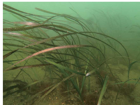
図2 復元しつつあるアマモ場。コンブ科およびホンダワラ科の海藻も混在している。

被災後の底質およびアマモ場 (図2) の変遷のモニタリングを、宮古湾湾奥において年に1回の頻度で毎年実施した 1) 。アマモ場の復元には、底泥の変化の有無が強く影響していた。植物と基盤の復元速度の差が、元の生態系に戻るか、別の生態系になるかの要因になると考えられる。