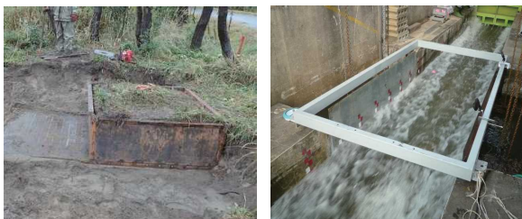
写真 (左) 供試体採取状況と(右) 通水実験

実際の海岸林等から採取した地盤を供試体として実験水路内に設置し、津波を模した最大7m/sの流れをその表面上を通し(写真)、侵食量を計測した。河川堤防の侵食量を評価した既往の研究では侵食抑制性能が根の量と関連が深いことが示されており、本研究においても侵食抑制性能を表す \alpha (大きい程侵食され易い)と根との量の関係式を整理し(図-1)、 \alpha の値の最大値はおおむね30程度となることを示した。また、図-1の関係式から、根毛量や植生状況を調べることでその地点の \alpha を推計出来ることが示唆された。