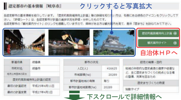
図-2 各認定都市のページ(例:岐阜市)