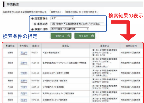
図-3 情報検索のページ(例:事業検索)