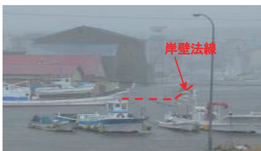
写真 根室港の浸水状況 (10/8 13時頃)

また、2015年の台風の特徴として、一つの台風が台風の勢力を維持していた期間の平均値が7.4日と最も長くなっている。このため、台風が北上した後も勢力が衰えない場合があり、10月には北海道の根室港で高潮による被災が発生している。