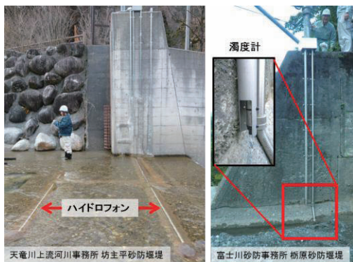
写真 流砂観測施設の例

山地流域における土砂動態の把握は、砂防基本計画の策定や総合的な土砂管理方針の検討、また国土監視の観点からも重要である。これまでも砂防堰堤の堆砂測量結果等から流砂量を推定する試みがなされてきた。しかし、これらの方法は多大な労力を要する上に、時間分解能が粗い等、課題があった。一方、近年直轄砂防事務所を中心に、河床に設置した金属管に掃流砂が衝突する際に発生する音響によって掃流砂量を観測するハイドロフォン、また濁度計を用いた手法により流砂水文観測が実施されるようになってきた 1) (写真)。そこで砂防研究室では、直轄砂防事務所で観測された流砂水文観測データを河川砂防技術基準 (調査編) で位置づけられた「流砂量年表」としてとりまとめた。