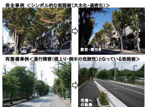
写真 街路樹の再生事例