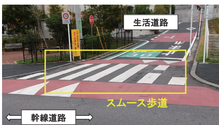
写真2 スムース歩道(交差点の歩行部分をかさ上げて車道に対して段差を設けている)

中でも、車両の速度抑制施設については、現状で設置基準が示されていないことから既存の知見をとりまとめるとともに、幹線道路側で設置可能な対策の効果検証などを中心に調査分析を行った。このうち幹線道路側からの対策に関する調査では、生活道路への車両進入部分における交差点狭さく(写真1)やスムーズ歩道(写真2)を採用した場合、車両の速度が抑制されるとともに、安全意識の向上や歩行者の見つけやすさが向上するなど、幅広い効果が得られることが示された(図)。