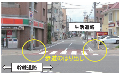
写真1 交差点狭さく(交差点部の歩道を張り出し生活道路への車両進入部分を狭くしている)

国総研では、凸部や狭さく部の設置効果の提示をはじめ、各地域が対策内容を具体的に選択する際の支援となる研究を進めている。