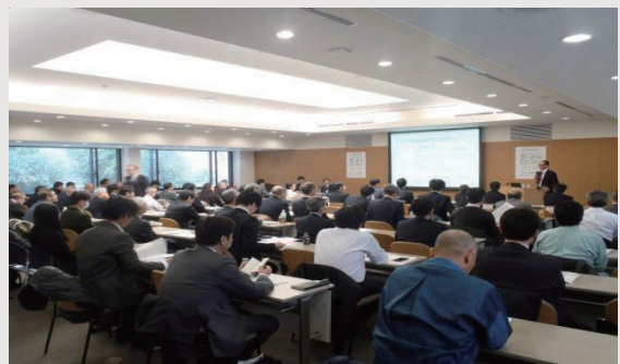
図 河川構造物管理研究セミナー

年行った点検マニュアルの検討とその後の試行を踏まえ、点検結果の評価の基準・要領の作成に向けた検討に関して技術的支援を行った。この検討の参考とするため、英国等海外のインフラの維持管理手法に関する情報収集を行い、我が国における維持管理手法との違いの分析も行った。技術相談に関しては、地方公共団体からも9件の相談が寄せられた。また、2014年2月27日に、産官学が連携して維持管理に関する最新情報の交換を行う場となる河川構造物管理研究セミナーを「海外の維持管理手法とデータベース」をテーマに開催し、約100名の参加を得て、熱心な討議が行われた。河川構造物TFの活動は詳しくはHPをご覧ください。 1)