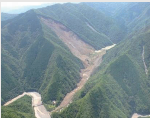
写真 平成23年紀伊半島で発生した深層崩壊

深層崩壊は通常の土砂災害に比べ発生頻度は低いが非常に規模が大きく、被害も甚大になる場合がある(写真)。一方で従来の砂防施設は、深層崩壊や深層崩壊に起因する天然ダム等に対して十分な耐力、規模を有しているとは言い難い場合があるなど、これまでの土砂災害対策では、深層崩壊への対策は十分な可能性がある。