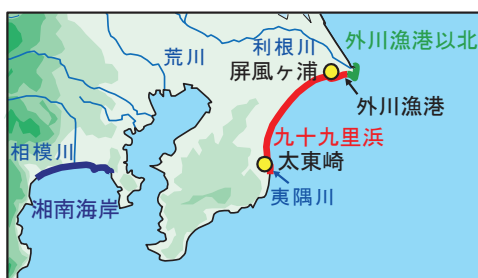
図1 砂の全岩分析をおこなった海岸

海岸の砂は多様な鉱物によって構成されており、顕微鏡下で鉱物組成を調べることで供給源を推定できる場合もある。しかし、鉱物の同定は熟練が必要とされる上、1標本につき100粒以上もの鉱物を同定する多大な労力を要する。そこで、砂の組成をより簡便に知る方法として、蛍光X線分析によって、砂全体に含まれる主要10元素と微量9元素を定量する全岩分析を試みた。