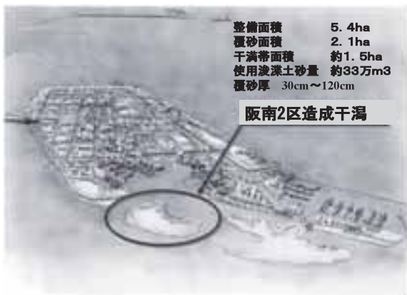
図-1：阪南2区整備事業完成予想図と造成干潟

阪南2区整備事業は、岸和田市沖合で大阪府港湾局が実施している約142haの埋立事業である。1968年7月に阪南港港湾計画に位置づけられ、1995年12月に阪南港港湾計画改定時に現在の計画に変更となり、1999年1月に公有水面埋立免許取得後、1999年2月に工事着工した。ここに、1995年の港湾計画改訂時に干潟の整備計画が位置付けられ、2004年2月に総面積5.4haの干潟が造成された（図-1）。