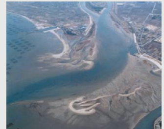
写真-1 榑田川河口干潟

試験調査を三重県榑田川河口干潟で行い、水深50cm以深を計測可能なこと、システムの有効性などを確認しました。