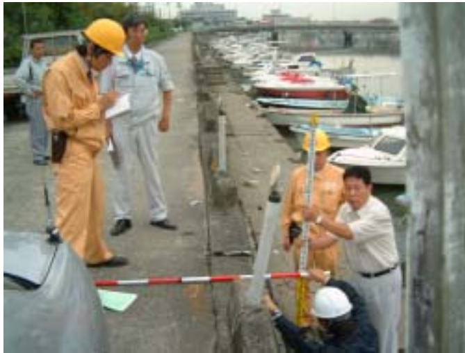
現地調査の状況（高潮による浸水の痕跡調査：高松市福岡町）