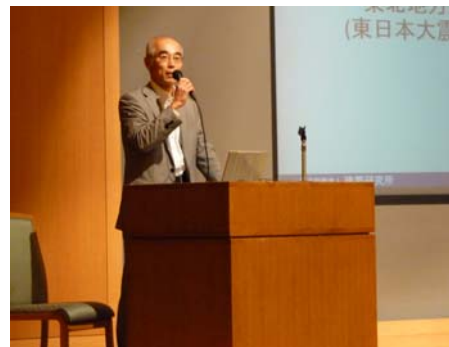
閉会の挨拶（国総研 水流副所長）