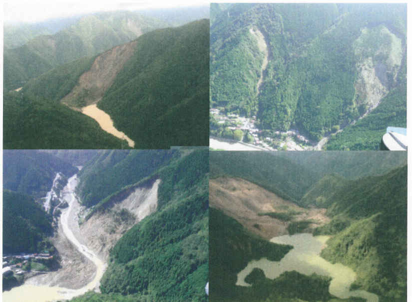
2011年台風12号では、1回の雨で約1億m 3 の斜面崩壊が発生。

これまで、砂防施設の整備や河道掘削、貯水池からの排土といった対応は行われていますが、通常の維持管理で想定されている土砂管理のレベルを大きく上回るような不安定な土砂生産があった場合には、 対策の規模、対策の期間が通常とは大きく異なることが想定されます。