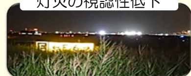
標識の視認性低下