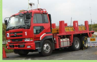
無人で自動走行している荷重車の見学と最新舗装技術をご説明します (舗装走行実験場)