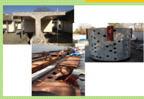
老朽化等により撤去された橋の部材を用いた研究をご紹介します (橋梁撤去部材)

主催 国土交通省国土技術政策総合研究所 Tel. 029-864-2211 独立行政法人土木研究所 Tel. 029-879-6700