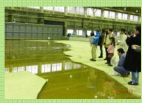
津波の河川遡上に関する実験施設をご案内します (海洋沿岸実験施設)