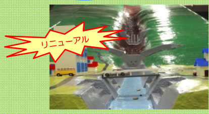
「土石流発生装置」を今年3月にリニューアル！今回初披露します

10:00 / 11:00 / 13:00 / 14:00 / 15:00 所要約60分