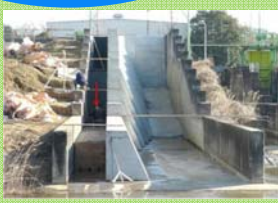
粘り強い海岸堤防の実験施設をご案内します (高落差実験水路)