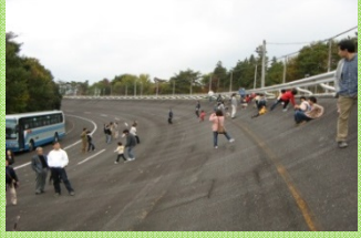
バスで「試験走路」を高速走行します

10:00 / 10:45 / 11:30 / 13:00 / 13:45 / 14:30 / 15:15 所要約45分 ※Bコースは、安全のため、ご乗車を小学生以上とさせていただきます。