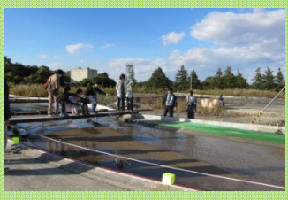
所内でも有数、広大な川の実験場をご案内します (河川模型実験施設)

あの「地震体験車」が、今年も研究所にやってきます。 決して薄らいではならない地震に対する意識、備えを改めて確認してみませんか？