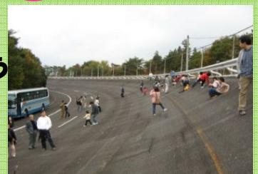
かなりの傾斜です。バスで高速走行します（試験走路）