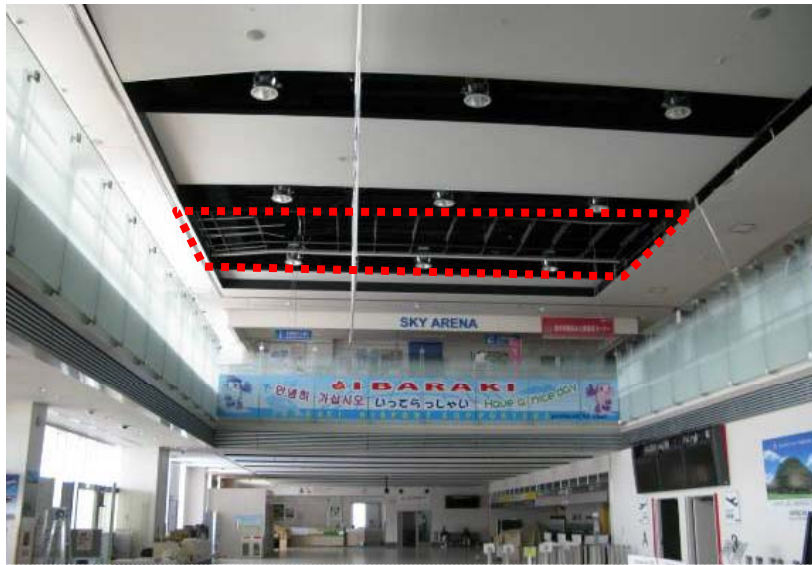
空港ターミナルビルにおける天井脱落