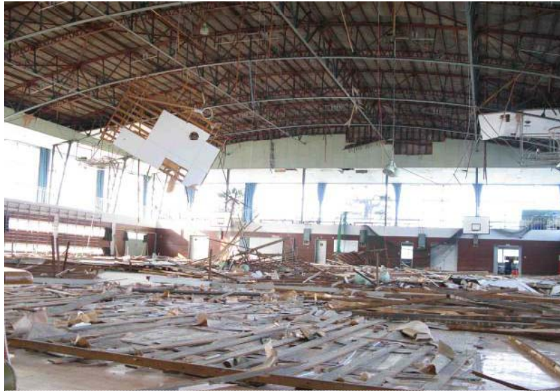
木下地による天井の脱落