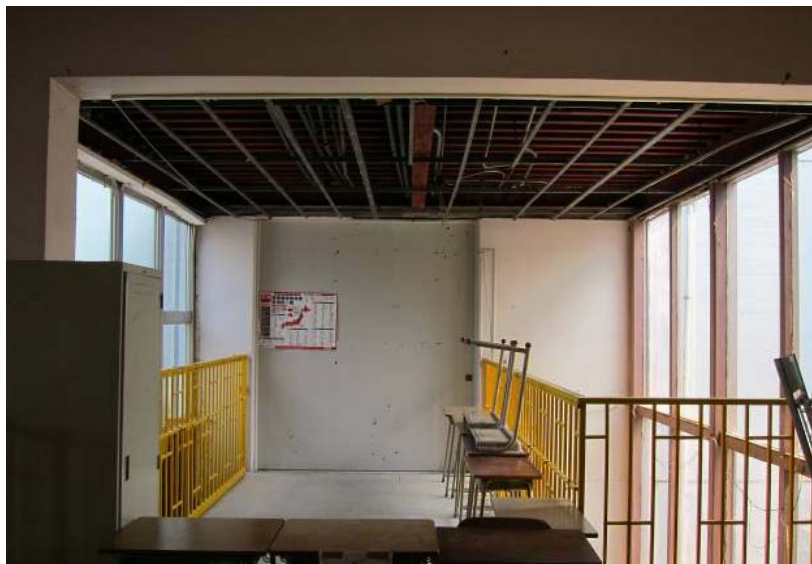
低層建物の接続部における天井脱落