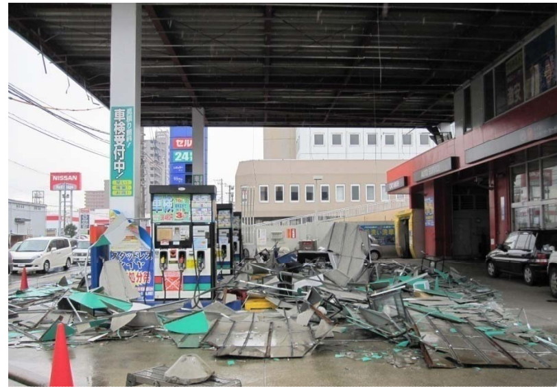
ガソリンスタンドにおける天井脱落