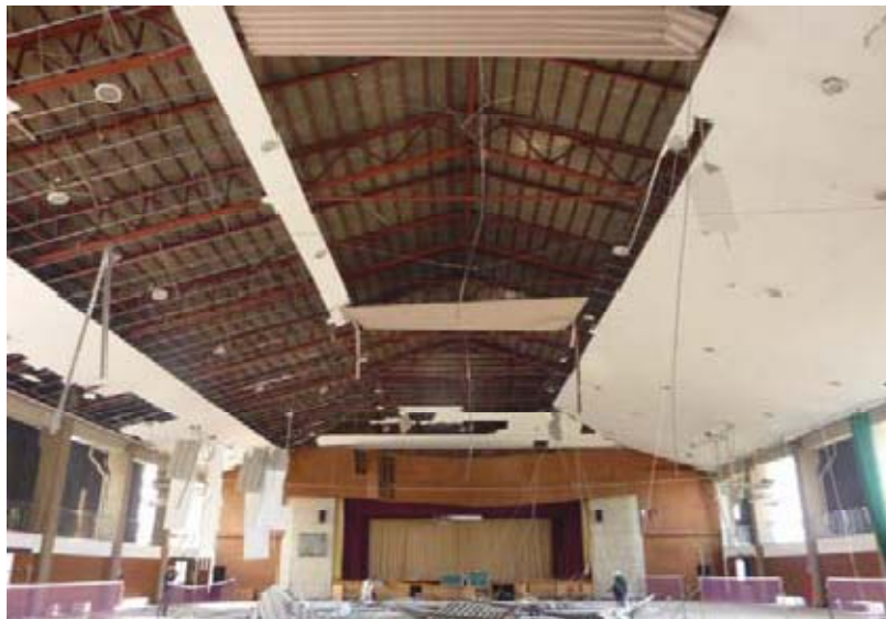
在来工法による天井等の脱落