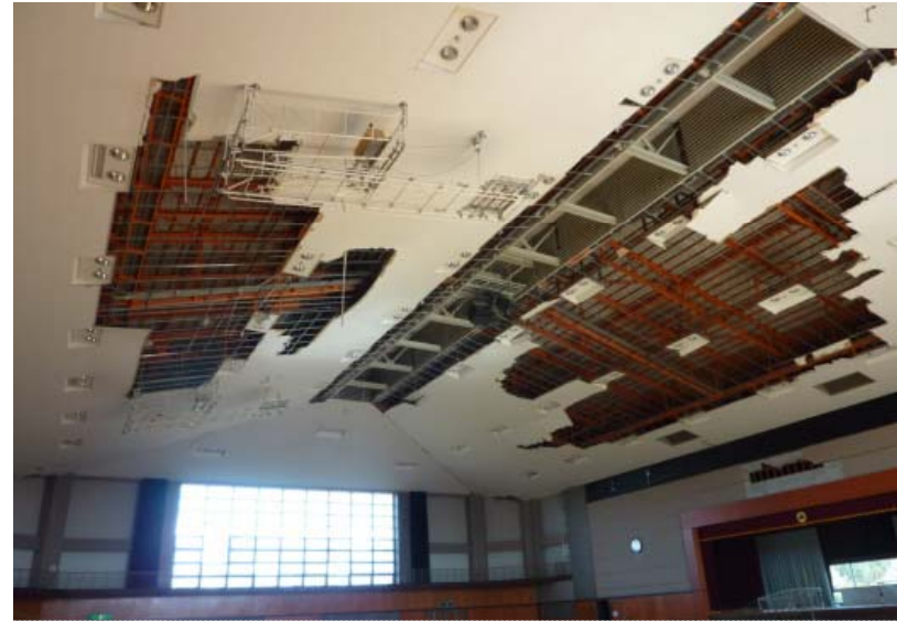
在来工法による天井の脱落