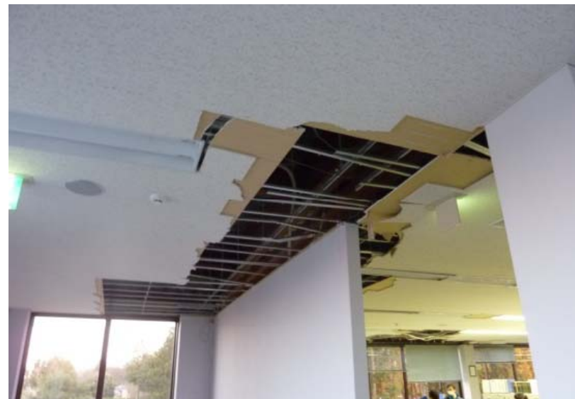
間仕切り壁上部における天井脱落